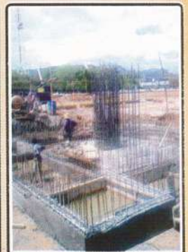
නනනු මුන බුදු පිලිවයේ ආකෘතිය