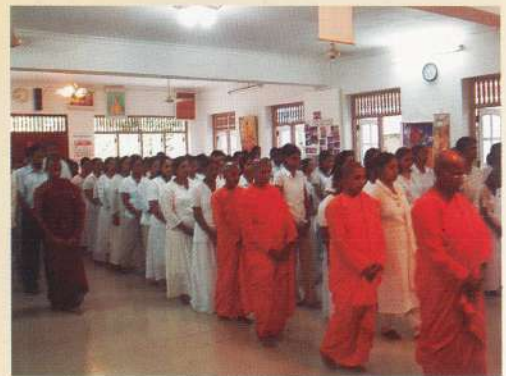
14 වන නාවනා වැඩසටහනේ, අවස්ථා කීපයක්.....