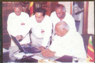
අග්‍රාමාත්‍යතුමන් හමු වීම

නිතින් මෙත් සිතින් මම් වෙසෙම් වා! ගතින් මෙත් සිතින් රෝ මුදුම් වා! බැතින් තුන් රුවන් ඔප නගම් වා! මෙතින් හෙත් පියම් වා නිවෙම් වා!