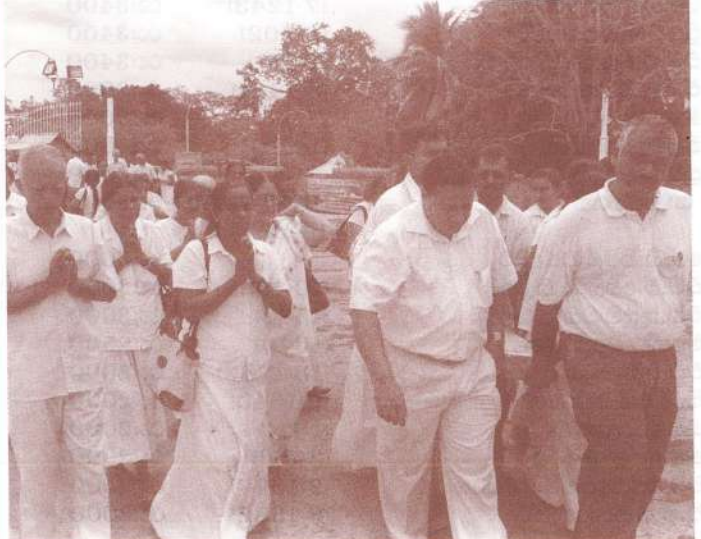
සටහන - සංස්කාරකගෙහි.

අප දේශයේ අසහාය විමුක්ති දයකයානන් ලෙසින් ඉතිහාසයට එක්වී ඇති දුටුගැමුණු නරචරුවාණන් විසින් ඉදිකල ප්‍රථම වෛතස මිරසවැටියයි. මහාවංශයේ සඳහන් වන පරිදි දිනක් මහ රජතුමා මහා ජල ක්‍රීඩාවක් කරණු පිණිස උත්සවශ්‍රීයෙන් තිසාවැවට සම්ප්‍රාප්ත වූයේය. එම මොහොතට ගෙන එන ලද්ද වූ සියලු පර්නෝග භාණ්ඩද, සිය ගණන් පඬුරුද එක් ස්ථානයක තබා ජල ක්‍රීඩාවට ගියහ. කුන්තායුධය (සධාතුක ජය කොන්තය) උසුලන්නාවූ රාජ පුරුෂයෝ ධාතු සහිතව කුන්තායුධය එම ස්ථානයේම සෘජු කොට තැබූහ. සවස් භාගයේ ජල ක්‍රීඩා හමාර කොට මහ රජ තෙමේ රාජපුරුෂයින් අමතා “යනු කැමැත්තමිහ, කුන්තායුධය වඩවිය” කීය. රාජ පුරුෂයින්ට එම කුන්තායුධය සෙලවීමට නොහැකි විය. රජ තෙමේ මේ මහත් අශ්චර්ය දැක සතුටු සිත් ඇත්තේ, කුන්තායුධය සුවඳ මලින් පිදුන. එහි ආරක්ෂා සංවිධානය කොට ධාතුන් සහිත කුන්තායුධය පරික්ෂිප්ත කරවා තුන් අවුරුද්දකින් මහා වෛතසක් කරවා, හික්ෂුන් ලක්ෂයක් ද, හික්ෂුණින් අනුදහසක් ද වඩම්වා සඝසතු කොට පූජා කළේය. දුටුගැමුණු මහරජ තෙමේ මෙම වෛතසයට නම් තැබීමේ දී සංඝයා සිහිනොකොට මිරස් වැටියක් අනුභව කලාවූ වරදට දඬුවම් පිණිස මිරසවැටිය නමින් නම් තැබූ බැව් මහා සංඝරත්නය හමුවේ ප්‍රකාශ කල බවත් සඳහන් වේ. අතීතයේ දී මෙම වෛතස පුර්විනා වෛතස නමින් හඳුන්වා ඇත්තේ දුටුගැමුණු මහරජ තෙමේ තම සුවිශේෂ කාර්යයන් සඳහා යන විට මෙම වෛතසයට පුර්විනා කොට භාර වීම හේතු කොට යැයි ද ජනවහරේ සඳහන් වේ.