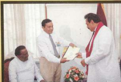
අති ගරු ජනාධිපතිතුමා හමුවීම