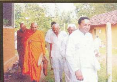
කඳුවොඩ සුමනිපාල අනුස්මරණ ආරණ්‍යයේ දී