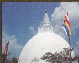
මිරිසවැටිය වෛතස රාජයානන් වහන්සේ