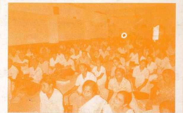
කොළඹ බොද්දාලෝක මාවතේ ධර්ම ගවේෂී බොද්දාලෝකයේදී පුරම භාවනා වැඩසටහන පැවැත්වෙන අවස්ථාවක්.....

කෙළින්ම කඳුබොඩට පැමිණෙන සාමාජිකයින් පෙරවරු 8.30 වන විට පැමිණිය යුතුය. කොළඹ සිට පැමිණෙන අය සඳහා බස්රථ සංවිධානය කරනු ලැබේ. මේ සඳහා පැමිණෙන අය පෙරවරු 7.00 ට කොළඹ බොද්දාලෝක මාවතේ පිහිටි ධර්ම ගවේෂී බොද්දාලෝක පැමිණිය යුතුය. සංසදයේ සාමාජික හැඳුනුම්පත් සඳහා ජායාරූප ගැනීම පෙරවරු 7.00 සිට 7.30 දක්වා සිදු කරන අතර ඉන්පසු පෙරවරු 7.30 ට පමණ බස්රථ කඳුබොඩ බලා මෙම ස්ථානයෙන් පිටත්වනු ඇත. සියලු බොද්දා සාමාජිකයින් අටසිල් සමාදන් වීම සඳහා සුදුසු