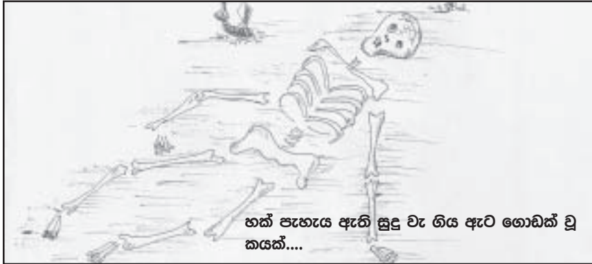
හත් පැහැය ඇති සුදු වැ ගිය ඇට ගොඩක් වූ කයක්....