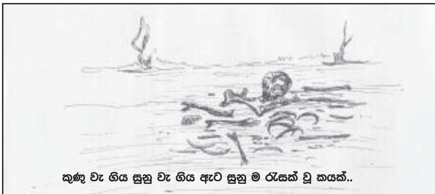
කුණු වැ ගිය සුනු වැ ගිය ඇට සුනු ම රැසක් වූ කයක්..