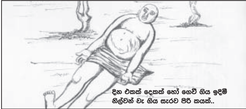
දින එකක් දෙකක් හෝ ගෙවී ගිය ඉදිමී නිල්වන් වැ ගිය සැරව පිරි කයක්..