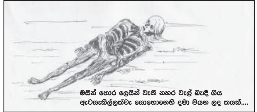
මසින් තොර ලෙයින් වැකි නහර වැල් බැඳී ගිය ඇටසැකිල්ලක්වැ සොහොනෙහි දමා පියන ලද කයක්....