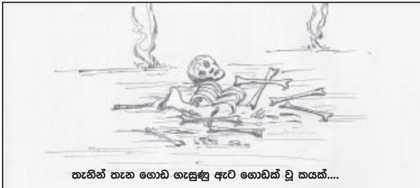
තැනින් තැන ගොඩ ගැසුණු ඇට ගොඩක් වූ කයක්....