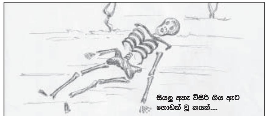
සියලු අතැ විසිරී ගිය ඇට ගොඩක් වූ කයක්....