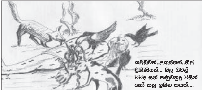
කවුඩුවන්..උකුස්සන්..ගිජු ලිහිණියන්... බල සිවල් විවිද සත් පණුවනුද විසින් හෝ කනු ලබන කයක්....