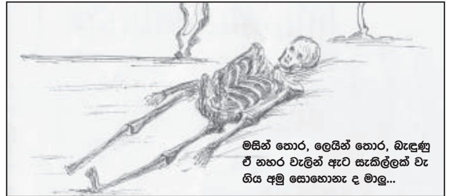
මසින් තොර, ලෙයින් තොර, බැඳුණු ඒ නහර වැලින් ඇට සැකිල්ලක් වැ ගිය අමු සොහොනැ ද මාලු...